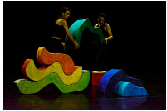
De gauche à droite : découpage Henri Matisse, jouet en bois Waldorf, création de la scénographie d'Un Secret perché