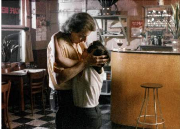
Toute une nuit / C. Akerman 1982