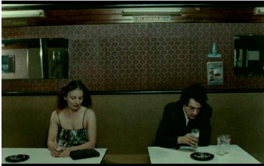
Toute une nuit / C. Akerman 1982

Dans Toute une nuit la cinéaste installe un rapport au temps qui est presque de l'ordre de la réalité ce qui la rend très proche à cet endroit de la question du temps dans une pièce chorégraphique.