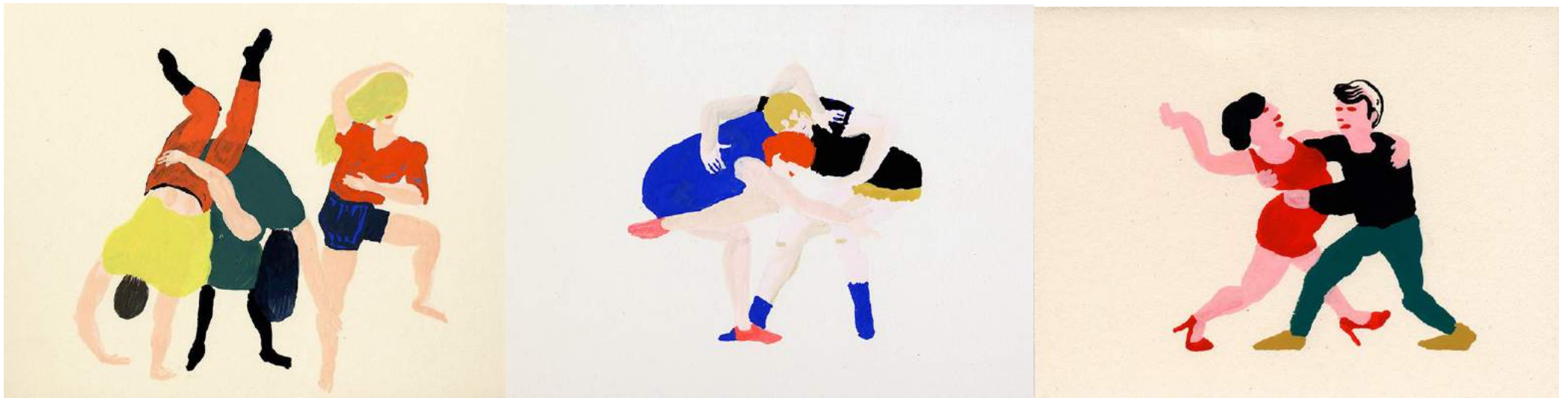
Laurent Eisler - Gouaches sur carton / série danse / www.laurenteisler.fr

Spectacle / Partition pour 4 danseurs et 6 danseurs amateurs