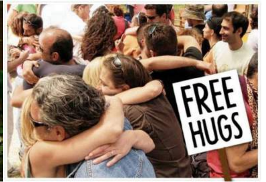
G. Klimt / L'Étreinte