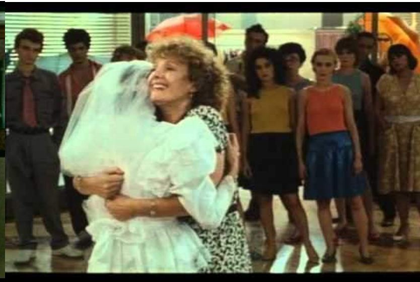
Golden Eighties / C. Akerman 1986