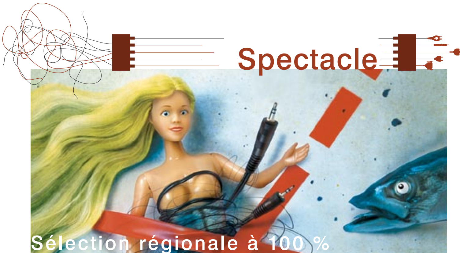
Illustration : Tilby